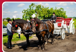
Przejażdżka zabytkową bryczką