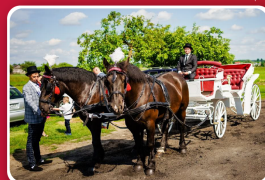
Przejażdżka zabytkową bryczką