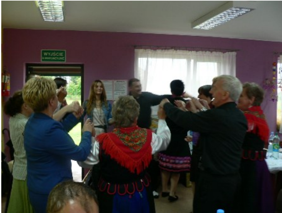
Mimo deszczowej pogody przy występie Orkiestry Dętej z Trąbek goście bawili się wyśmienicie.