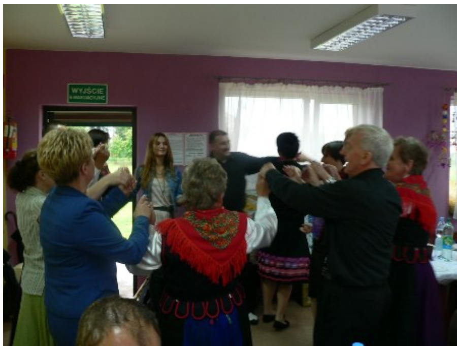
Mimo deszczowej pogody przy występie Orkiestry Dętej z Trąbek goście bawili się wyśmienicie.